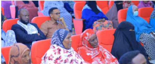
HIBO XASAN AGAASMANHA QORSHEYNTA DAWLADDA HOOSE EE GABILEY

Mashruucani waxa uu fursad nololeed siiyay 250 qoys oo maanta meel fiican kaga jira bushada waxaanu dhiirrigaliyeen inuu mashruucu noqdo mid sii socdo, waxayna dhamaanba soo celiyeen intii laga doonayay oo ah 50% inta la daymiyay, waxay horseed u tahay iyo bilaw cusub kor u qaadida iyo dhiiri galinta bulshada. Guud ahaanba waxa is badal ku keeneen dhaligil dawlada hoose kaas oo kor u qaadida qaysaska ka faa'day ay isbadal muuqda ku sameeyeen cashuurta ka soo xaroota ganacasiga yaryar.