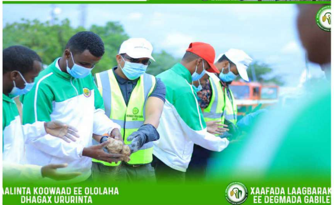
MAGALINTA KOOWAAD EE OLOLAHA DHAGAX URURINTA